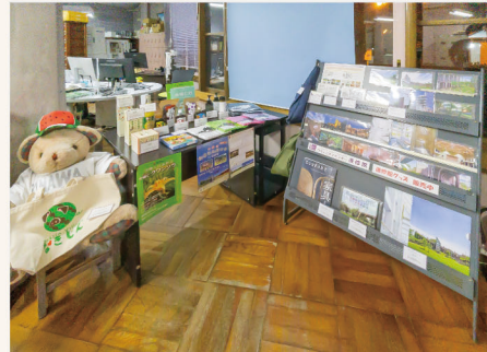
物販コーナーは、進修館1F窓口（ボランティア室）にあります。右手のラックは進修館関連、カウンターは今帰仁村グッズです。

現在は、進修館オリジナルグッズ（ポストカード、エコバッグ、クリアケースなど）や、久喜市にある著名な自家焙煎珈琲&ジャズ喫茶「珈琲パウエル」さんに焙煎・ブレンドしていただいた「進修館ブレンド」のほか、11月4日に開催された「なきじんまつり in 進修館」にお越しになっていた今帰仁村の方々の商品を取り扱っています。