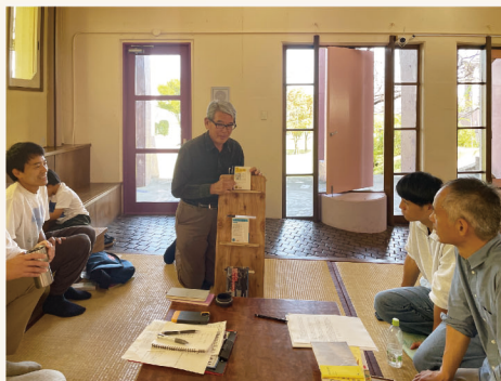
【へそ本委員会の様子】 話し合いの中でも「へそ本」自慢をする委員のみなさん。本番が楽しみです。

そしてこの度、選りすぐりの「へそ本」をロビーに展示する活動展を開催します。また、開催初日には「へそ本」出展者が本への想いを熱く語るトークセッションも開催！本を通じた「へそ自慢」をお楽しみください。