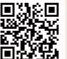
キャンドルナイト 去来ホームページ

日時：2024年12月14日(土) 17:00～19:00 場所：四季の丘(芝生広場) 参加費：無料 主催：社会福祉法人じりつ http://bit.ly/jiritsu-candle 共催：宮代町立コミュニティセンター進修館 後援：宮代町・宮代町教育委員会 宮代町商工会青年部・宮代町社会福祉協議会 問合せ：社会福祉法人じりつ 0480-53-4571 当日連絡先：進修館 窓口、0480-33-3846、info@shinsyukan.or.jp