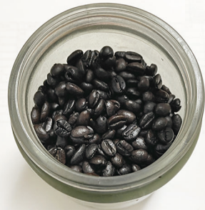
進修館ブレンドは、旨味・コク・甘みのバランスのとれた、珈琲好きも納得の逸品。ブラックはもちろんミルクとの相性も抜群。

現時点で売上好調なのは、やはり今帰仁村のグッズ。特に上の写真左側、クマが持っているトートバッグが好評です。今帰仁村グッズは次回入荷が未定なので、気になる方はお早めに。なお進修館グッズの中では、進修館ブレンドが好評です。