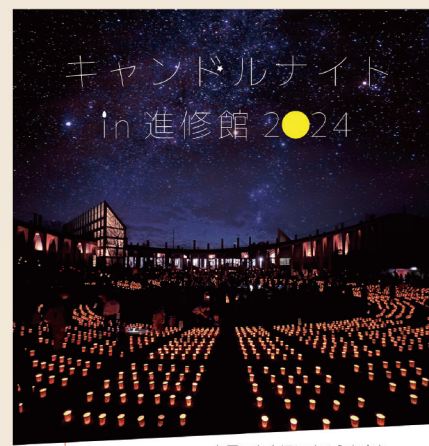
お互いを大切にすることを 「ありがとう」を言葉に。 12月14日(土)17時～19時 会場/宮代町立コミュニティセンター進修館(四季の丘)

進修館の冬の風物詩、「キャンドルナイト in 進修館」が今年も開催されます。「大切な人への感謝の気持ちを伝える」ことをテーマとしているこの催しは、宮代町内の幼稚園・保育園・小中学校の子どもたちによる感謝の言葉が書かれた手作