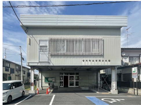
稲荷町町内会の拠点となっている百間集会所は、百間公民館2階にあります。