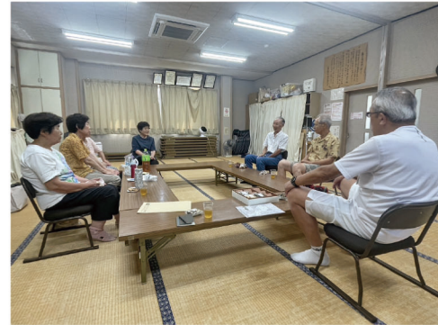
和やかに開催されているサロンの様子。この日の参加者は7名でした。

東小学校を擁する住宅地にある稲荷町町内会は、百間公民館の2階にある百間集会所を拠点にしています。今回は、この百間集会所で毎月開催されているサロンにおじゃまして、お話を伺いました。