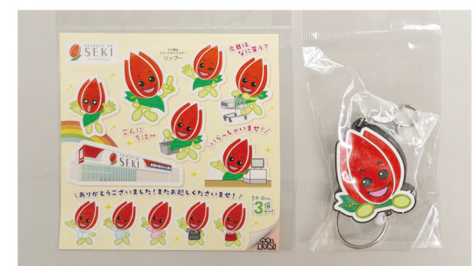
ステッカー(99円)とキーホルダー(399円)

みなさんも、店頭でセキ薬品オリジナルグッズを見かけたら、購入して日頃お世話になっているセキ薬品を応援しましょう！