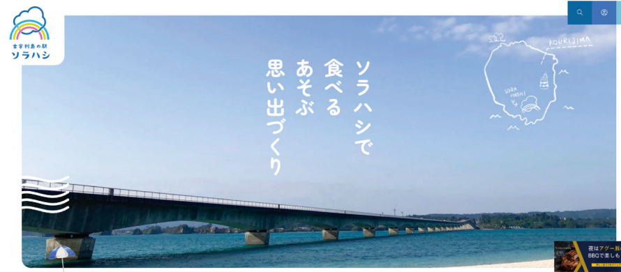
「古宇利島の駅 ソラハシ」のウェブサイトには、沖縄屈指の絶景ポイント「古宇利大橋」が掲載されています。