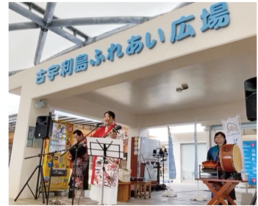
施設内にある「古宇利島ふれあいひろば」では、地元の人々による様々なイベントが開催されています。