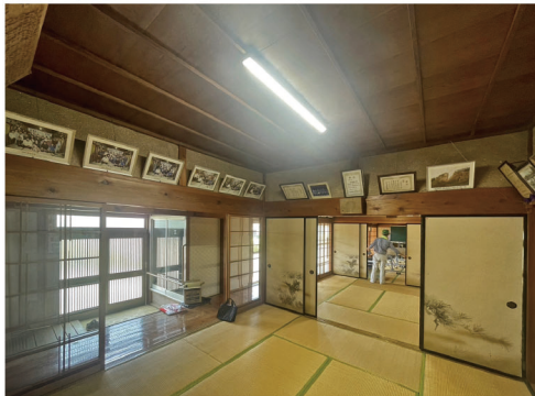
集会所内には写真や賞状などが飾られ、さながら地区の資料館のようです。

緑が多く、思わず深呼吸したくなるような金原地区には、広大な芝生を有するはらっパーク宮代もあります。取材に伺った日は、地区の集会所と隣接する稲荷神社の例祭の日で、五穀豊穡と地域の安寧を祈願する祭礼が行われていました。自治会活動とともに、歴史あるコミュニティについてのお話も伺うことができました。