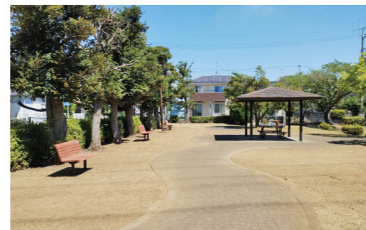
ゆったりとしたベンチエリア