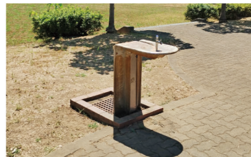
水道は水飲み場つき