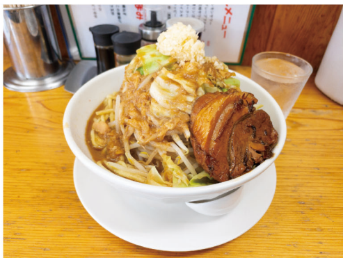
「食べてみたいけど一人じゃ無理…」という方は、他の注文と合わせて数人でシェアするといいかも。

大学通り沿いにある中華料理店「龍盛房」さんで食事をしていると、必ずと言ってもいい確率で「うわあ〜」とか「スゲェ！」といった感嘆の声が聞こえてきます。その理由が、コチラの「ドラゴンラーメン」。麺の上に積まれたキャベツともやしで高さは25cm以上、チャーシューの厚さは3cmほどと、唸り声も納得のボリュームです。いわゆる「二郎系ラーメン」にあたるものですが、その味もラーメンマニアの折り紙