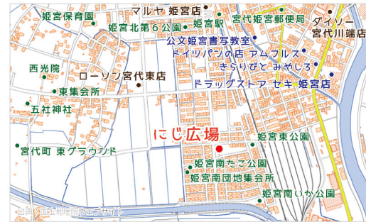
姫宮南団地エリア内には、特徴のある公園が4つもあります。その1つが、にじ広場です。

姫宮駅西口徒歩7分。閑静な住宅地にある広場。遊具はありませんが、そこそこ広さがあるので、小さいお子様から大人まで利用方法は多種多様。キレイな東屋があるので仲間とお話したり、ベンチでポ〜ッとしたり。すぐ近くに“たご”のいる“たご公園”、“いか”のいる“いか公園”、恐竜のいる“姫宮東公園”があるので、お子さんと公園めぐりするのも面白そうです。