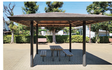
とてもキレイな東屋