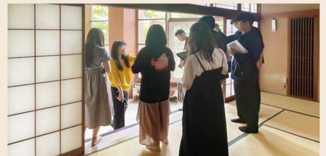
和室の視察の様子