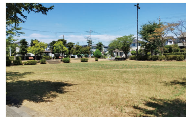
子どもが走り回るのに最適な広場