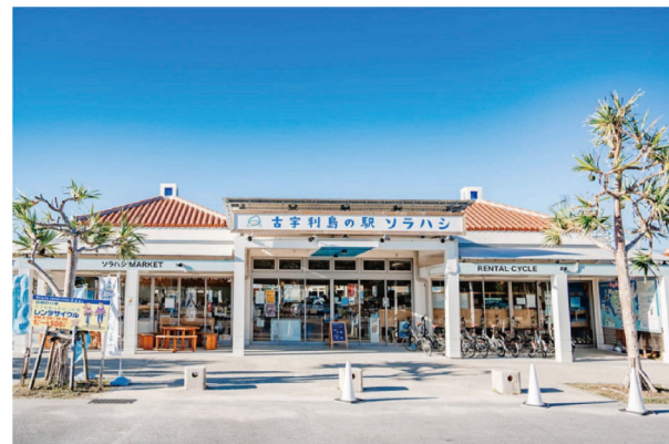
古宇利ビーチに隣接する「古宇利島の駅 ソラハシ」は、島の観光拠点として多くの観光客でにぎわっています。