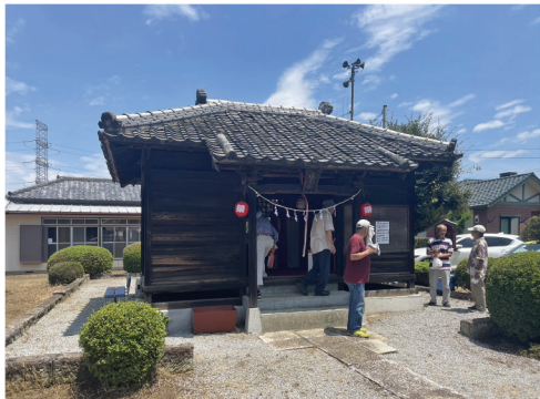
祭りの後片付けをする地域のみなさん。社社の裏手にあるのが集会所です。