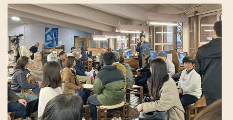
写真家・浅見俊哉氏による作品紹介

トークセッションが行われました。同日開催されていた「へそたんけん2024」のアーティストおよび作品の紹介も行なわれるなど、進修館の新しい可能性が垣間見えた1日となりました。