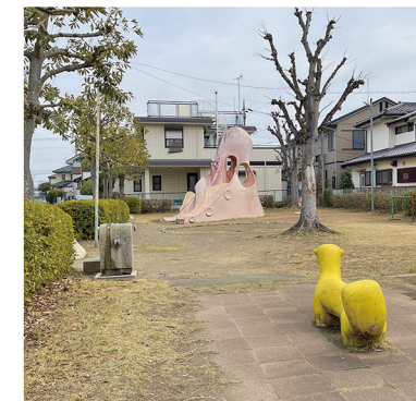
横から見ても圧倒的な存在感。手前には砂場、左手は鉄棒。