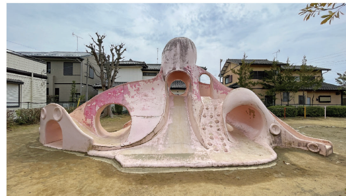
たこの滑り台は圧倒的な存在感。コンクリート製なので、お子さんを滑らせる際には、下に何か敷いた方が良さかも。

住所：東姫宮2丁目11番 遊具：たこ滑り台、砂場、鉄棒 動物オブジェ 休憩：パーゴラ（テーブル・椅子あり） 水道あり。トイレなし。 備考：姫宮南団地集会所に隣接。 すぐ近くに「にし公園」「姫宮東公園」少し歩くと「姫宮東いか公園」もあります。