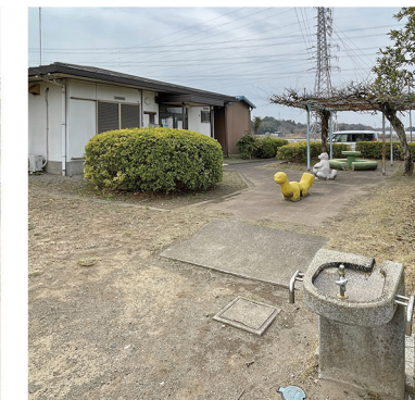
手洗い場の奥にはパーゴラ。左手は姫宮南団地集会所。