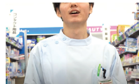
男性版はおなじみのあのメロディ♪

たセキ薬品。その記念に「元気だしてよ」の新ボーカルを社内公募したそうで、幾多の応募の中から男女2名が選ばれました。そして生まれ変わった「元気だしてよ」は、男女別々のニューバージョン。セキ薬品公式YouTubeチャンネルで2つのバージョンを聴くことができます。しかも、お二人のお顔も拝見できます！レコーディング風景や店舗でのシーンなど、とても素敵なミュージックビデオとなっているので、皆さんも視聴してみたいかが？