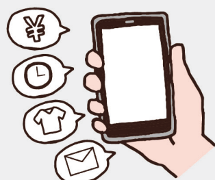
今年度は「スマホサロン」を開催。多くの方にお集まりいただきました。

進修館のアウトリーチ事業について、「ウチの集会所でも、是非開催してほしい」などありましたら、進修館までお気軽にご相談ください。