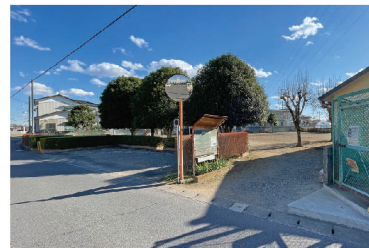
公園の入口横に5台分の駐車場があります。

これまでは、近隣に商店等はなかったのですが、12月1日に「とうふ屋豆いち」がオープン。豆腐を買いに来たついでにお子さんと公園に…という使い方もできそう。少し車を走らせれば新しい村にも行けるので、豆腐買ったあと西原児童公園の遊具でお子さんと遊んで、そのあと、新しい村に移動…という流れがいい感じかも。