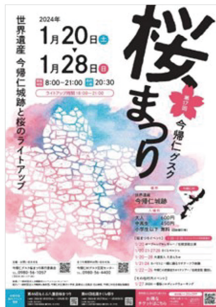
今帰仁グスク桜まつりのポスター。世界遺産と桜のライトアップは見ごたえ満点！とのこと。

このコーナーでは進修館と交流のある沖縄県今帰仁村との交流の様子やさまざまな情報をお届けします。