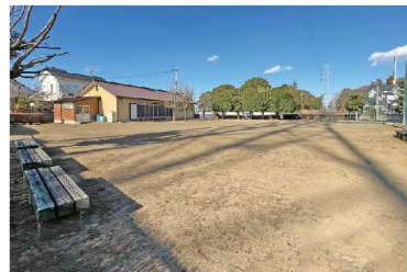
広くてきれいな園内。奥に見えるのは西原団地集会所。