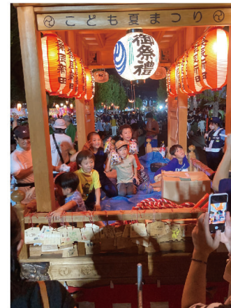
宮代町民まつりには山車の巡行で参加しています。山車を曳きたい子どもたちがたくさん集まります。