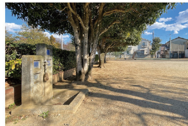
公園の入口付近に水道があります。