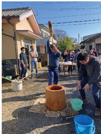
12月9日、自主防災会餅つき大会と子ども広場が合わせて開催され近隣の子どもたちも含めて200人ほどが参加しました。

高齢化や新規加入者の低下など、どの自治会でも抱えている課題は辰新田町内会にもありますが、コミュニティを大切にすることをしっかり持ちつつも「いい加減」で運営しているところに、この地区の居心地の良さを感じました。