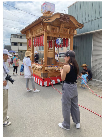
「こども夏祭り」では、町内会が所有する山車を曳いて練り歩きます。宮大工さんの技を感じる彫刻が施された立派な作りです。