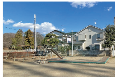
ブランコ・滑り台・砂場がある一角。