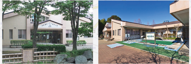
■ 旧ふれ愛センターみやしろ（現 福祉交流館 すてっ宮代）

進修館だよりを通じて交流させていただいている皆様をマップに掲載していく形でご紹介します！