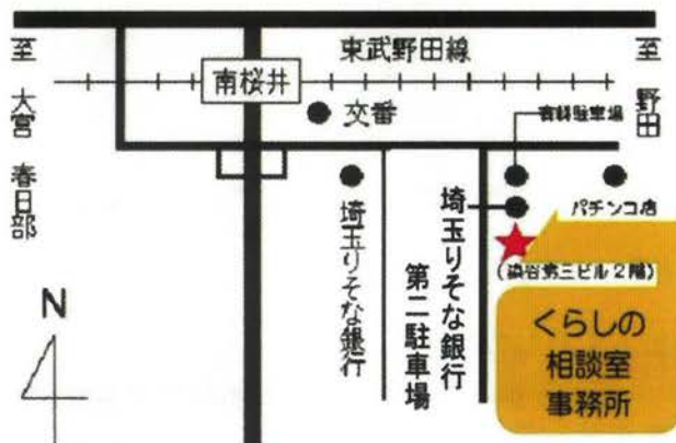
東武野田線 南桜井駅南口 徒歩3分