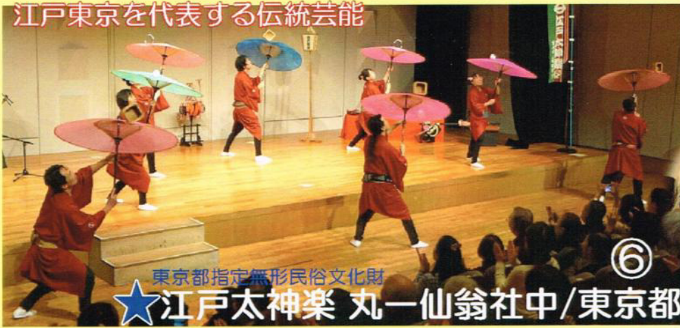
江戸東京を代表する伝統芸能 東京都指定無形民俗文化財 ★江戸太神楽 丸一仙翁社中/東京都